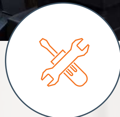
Maquinaria y herramientas